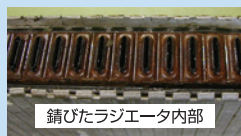
錆びたラジエータ内部