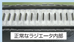
正常なラジエータ内部

エンジンの熱や酸化によりクーラントは徐々に劣化します。防錆性能が低下し、錆が発生すると冷却性能の低下や液漏れ、目詰まりなどを起こす恐れがあります。